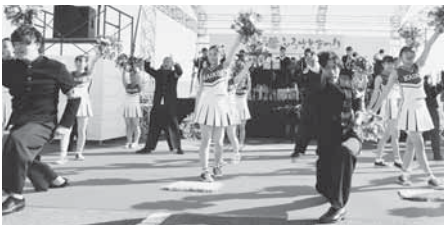
水海道一高応援団&チアリーディングによるオープニングセレモニー