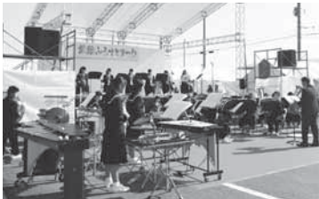
石下西中吹奏楽部による演奏