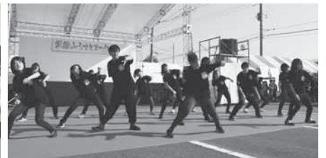
石下紫峰高生によるダンス