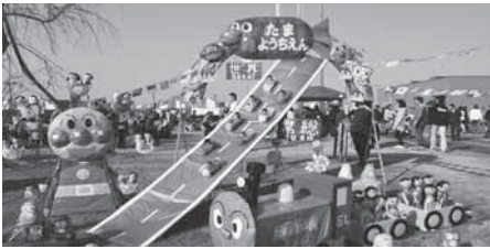
かかしコンテスト最優秀作品・玉幼稚園

11月5日、第25回常総ふるさとまつりが石下庁舎周辺で開催され、25,000人の人が訪れました。当日は、市内の50を超えるお店が並んだほか、ステージでは「ジュニアのど自慢大会」などさまざまなイベントが行われ観客を楽しませていました。