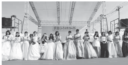
水海道二高家政科による創作ドレスショー