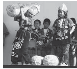
玉小学校による天神ばやし