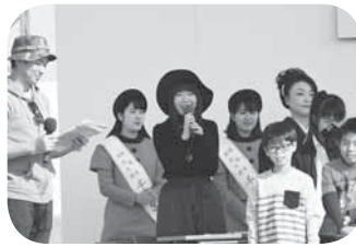
常総ふるさと大使の皆さんも会場を盛り上げてくれました