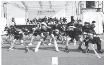
豊田小の「とよだっ子ソーラン」