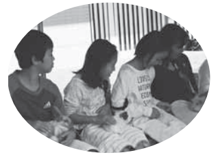
あすなるの里による出張ふれあい動物園