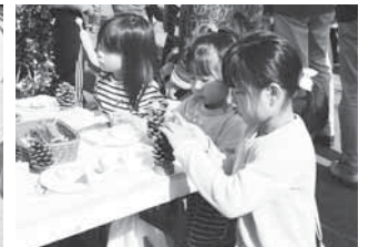
松ぼっくりで素敵な飾り作り