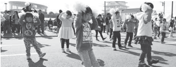
幼稚園児のかわいい踊り