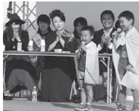
ジュニアのど自慢大会