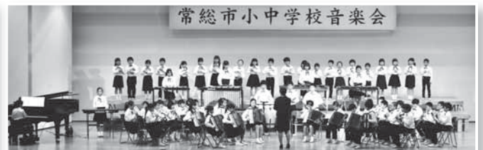
常総市小中学校音楽会