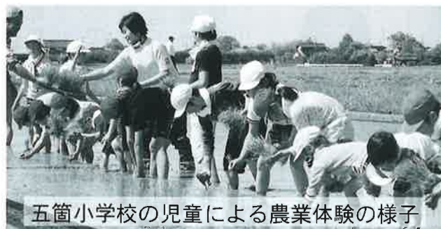
五箇小学校の児童による農業体験の様子